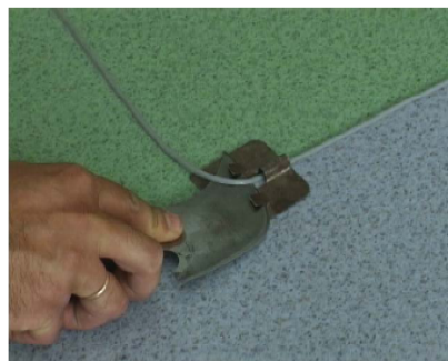
Wstępne ścinanie spawu

zimno spawania na prowadzić w montażu domowych, drobnych logo,) lub jeżeli sznura kompozycję pomieszczenia: