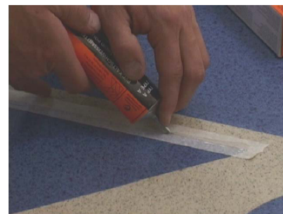
Wprowadzanie żelu do naciętej spoiny

wyschnięciu min, należy zabezpieczającą.