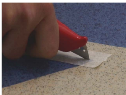
Nacinanie naklejonej taśmy na połączeniu arkuszy

. po całkowitym żelu, tj. ok. 30 zerwać taśmę