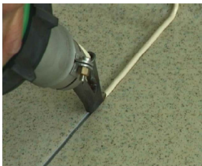
Spawanie urządzeniem ręcznym

Wykonanie zimno zaleca się przypadku przypadku wykładzin montażu elementów (np. wprowadzenie zaburzyłoby całą kolorystyczną