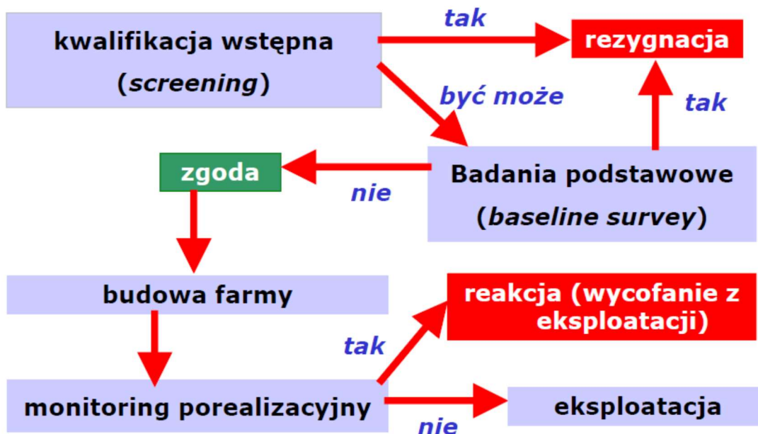
Rysunek nr 2. Schemat działań związanych z realizacją projektów odnawialnych źródeł energii